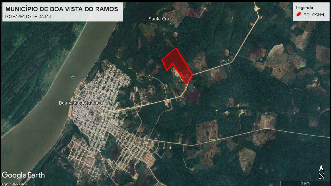
IMAGEM MACRO DE SATÉLITE - SITUAÇÃO SEM ESCALA